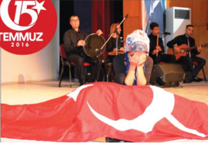
15 Temmuz Şehitlerini Anma Günü kapsamında düzenlenen şiir şöleninde okulumuz öğrencileri de görev aldılar.