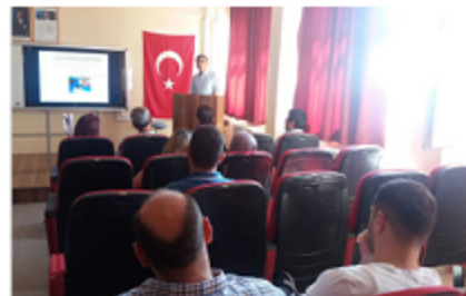
Açık Uçlu Soru Yazma Eğitimi