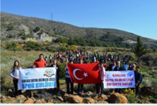
HATAY (AA) - Hatay'daki Karlisu Sosyal Bilimler Lisesi Spor Kulübü öğrencileri, her yıl düzenlenen doğa yürüyüşleriyle çevre bilinci kazanıyor.

Okuldaki Spor Kulübü tarafından geleneksel olarak yılda iki kez yapılan yürüyüşlerle