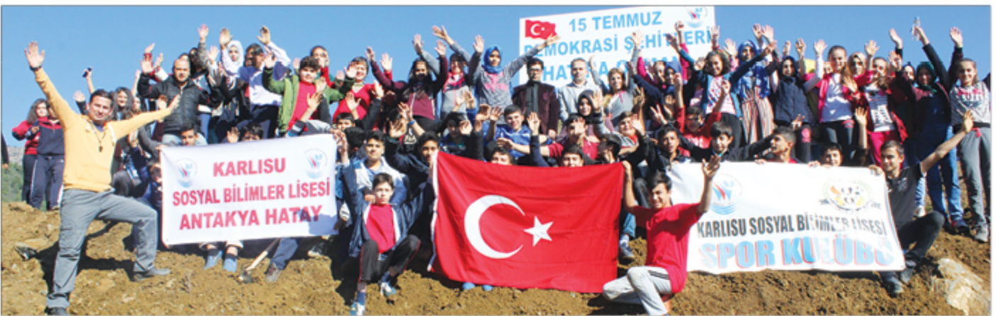
Okulumuz spor kulübü tarafından her yıl gerçekleştirdiğimiz fidan dikim etkinliği bu yıl da 15 Temmuz Demokrasi Şehitleri Hatıra Ormanı olarak gerçekleştirildi. Karlısu Köyü Orman Alanına 17 Kasım 2017 tarihinde okulumuz hazırlık sınıflarından oluşan 150 kişilik bir öğrenci grubu ile toplamda 500 fidan dikilmiştir.