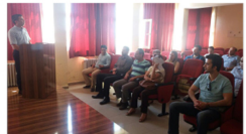
Eğitimde Yenilikçilik Ödülleri Eğitimi