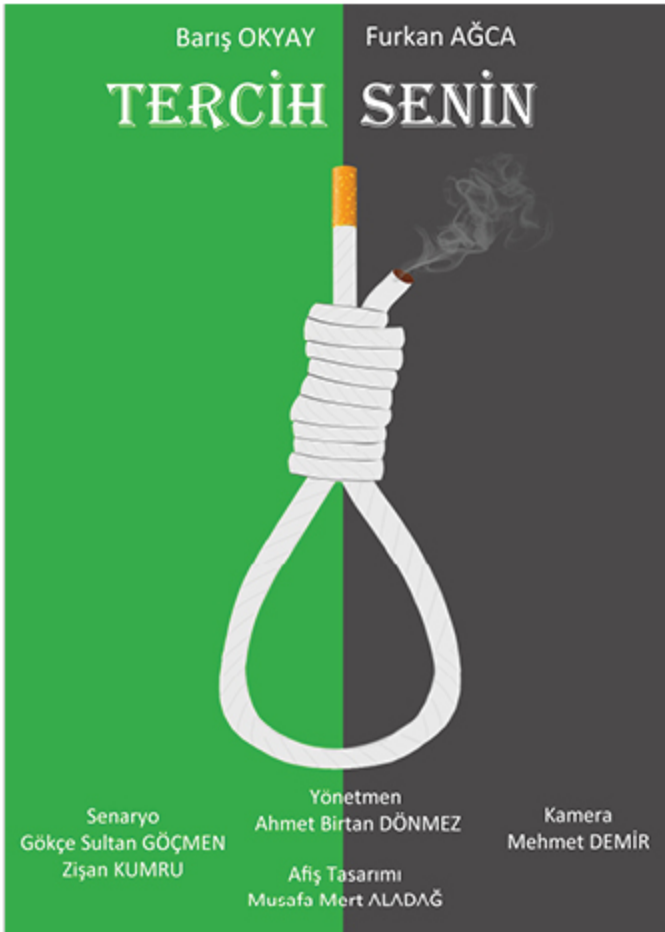
Yeşilay konulu kısa filmimizin afişi