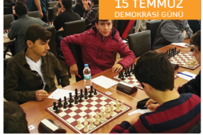
15 Temmuz Şehitlerini Anma Günü kapsamında okulumuz öğrencileri arasında bir satranç turnuvası düzenlendi.