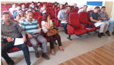
Erasmus K1, K2 Projesi Eğitimi