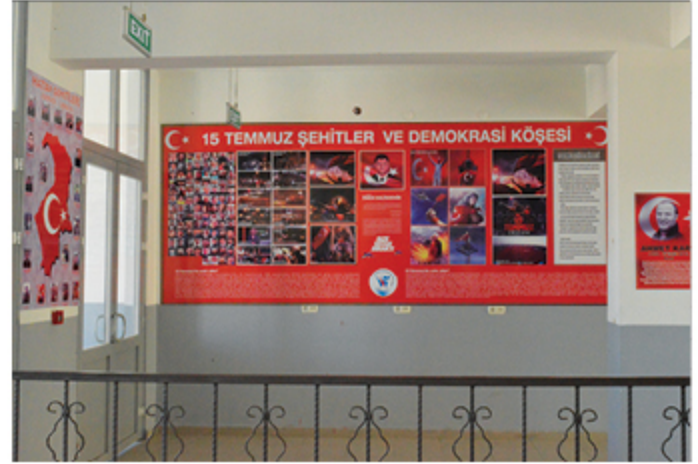
15 Temmuz Demokrasi Köşemiz